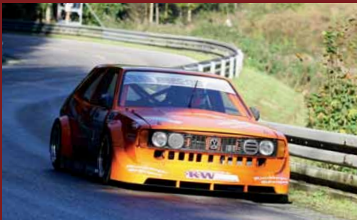
An zahlreichen Zuschauerpunkten entlang der Strecke sind die Fans in der ersten Reihe.