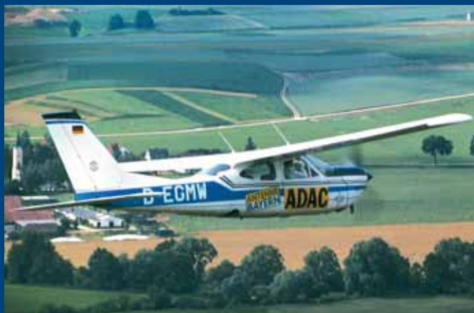
Steuern Sie die ADAC-Cessna: Bei „Drive & Fly“ in Landshut.

Der Traum vom Fliegen – der ADAC macht ihn wahr. Bei „Drive & Fly“ auf dem Fahrtrainingsplatz in Landshut sind Sie Pilot in einem echten Flugzeug. Starten Sie den Motor und heben Sie ab zum ultimativen Abenteuer. Steuern Sie selbst eine Cessna und erleben Sie Start, Flug und Landung auf dem Pilotensessel. Ein professioneller Fluglehrer an Ihrer Seite erklärt Ihnen, wie es geht. Absolvieren Sie den Safety-Check Ihres Flugzeugs und erleben Sie die Freiheit über den Wolken hautnah im Cockpit. Ganz einfach: Starten – fliegen – landen... träumen! Und dann geht es auf die Piste zu purem Fahrspaß beim ADAC Pkw-Kompakttraining. Kompakt, realitätsnah und mit jeder Menge Spaß lernen