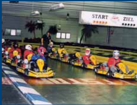
Einsteigen: Indoor Kartrennen des AC Bavaria.

Die Motorsportsaison ist fast zu Ende, doch der AC Bavaria gibt nochmals ordentlich Gas: Beim 1. ACB Indoor Kartrennen am 22. November ab 10 Uhr im Münchner Kartpalast. 600 Meter Rennstrecke mit Curbs, einem ausgeklügelten Zeitmess-System, Monitoren an der Bahn und speziellen Lichteffekten – so wird der Tag zu einem einzigartigen Erlebnis. Mitmachen kann jeder, Erwachsene und Jugendliche ab 14 Jahren, das Wichtigste ist Begeisterung für die rasante Sportart. Und das ist das Reglement: Zugelassen sind 16 Teams à drei Teilnehmer. Im Qualifikationstraining werden drei Einzelstarts mit jeweils sieben Runden und im anschließenden Hauptrennen 18 Runden absolviert. Die Ergebnisse der drei Teammitglieder aus den Einzelläufen wer-