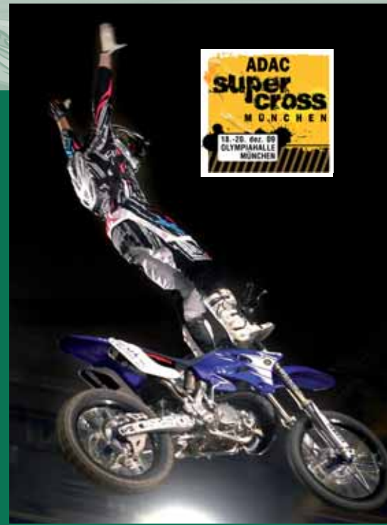
Atemberaubende Stunts, prickelnde Showeinlagen und meterhohe Sprünge bieten die Offroad-Köner.

am Gas ins Waschbrett steuern. „Ein Spektakel, das unter die Haut geht“, verspricht Berger. Vom Rahmenprogramm ganz zu schweigen. Wer dabei sein möchte, sollte sich schon jetzt Tickets sichern. Erhältlich unter Tel. 01805/ 500 130 (14 Cent/ Min. aus dem Festnetz der Dt. Telekom, Mobiltarife können abweichen) oder im Internet unter www.supercrossmuenchen.de .