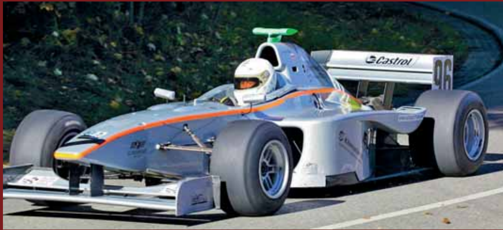
Donnern gnadenlos die 2,2 Kilometer-Strecke hinauf: Die Boliden beim Mickhauser Bergrennen.

Nun gut, das werden noch ein paar spannende Wochen für den ASC Bobingen und seinen Rennchef Günter Hetzer. Wäre da nicht der Idealismus ganz tief im Herzen eingegraben, hätte man längst alles hingeworfen. So aber wird weiter hart an der neunten Auflage des Bergrennens gearbeitet, werden hunderte von Metern Bauzäune aufgestellt, Lkw-Ladungen von