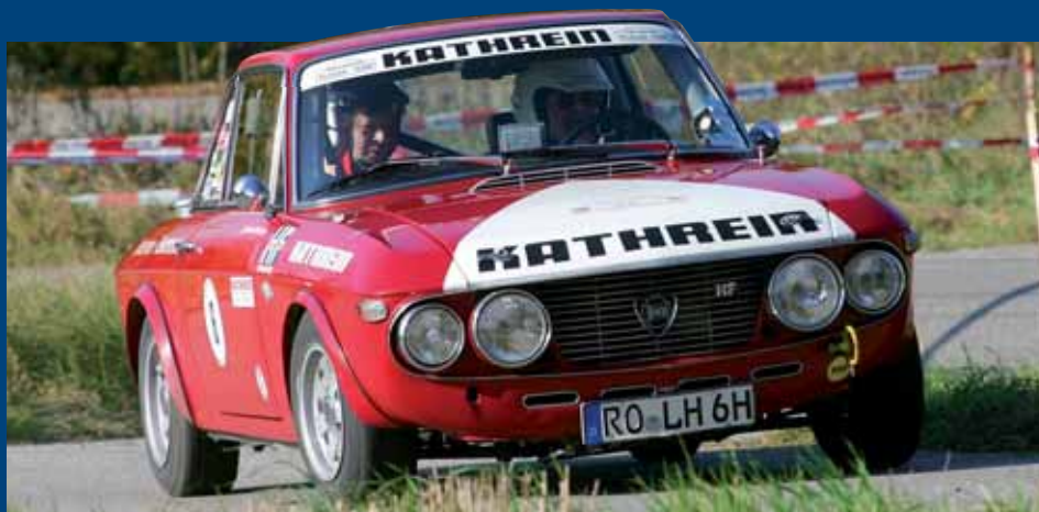
Mischen kräftig mit: Die Oldtimer bei der ADAC-RGR-KATHREIN Historic.

senheim den 7. ADAC-Karl-Eisenhofer-Gedächtnis-Rallye Sprint in den Panger Feldern südlich von Rosenheim. Das Besondere daran: Das Event findet größtenteils bei Nacht und unter Flutlicht statt. Die Teilnehmer haben einen Trainings- und drei Wertungsläufe auf einem hundertprozentigen Asphaltkurs zu bewältigen. Start ist um 16.30 Uhr, Siegerehrung beim Alten Wirt in Aising. Weitere Infos unter www.rg-rosenheim.de/rallyesprint .