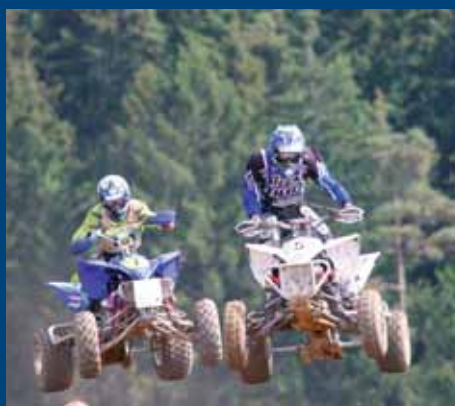
Spektakulär: Auch die Quads heben auf der Warchinger Piste ab.

Das Veranstaltungsgelände liegt an der B2 zwischen Augsburg und Nürnberg, Ausfahrt Monheim, von dort der Beschilderung folgen. Aktuelle Infos unter www.moto-warching.de .