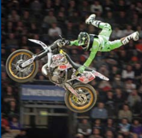
Schnell zugreifen! Der Ticketvorverkauf für das Münchner Supercross beginnt.

Spannende Rennen, waghalsige Sprünge und ein spektakuläres Rahmenprogramm mit Freestyle-Show: Das garantiert das ADAC Supercross am 18. und 19. Dezember in der Münchner Olympiahalle. Am 1. August beginnt der Ticketvorverkauf für dieses Event.