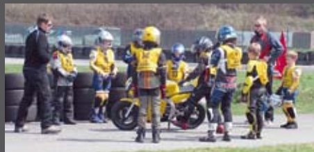
Beim Mini Bike Schnupperkurs in Garching kamen die Kleinen ganz groß raus.

Motocross- und Supermoto-Fahrer, wurden in vier Gruppen aufgeteilt und hatten jede Menge Spaß. Sieben Teilnehmer wurden von den Instrukto- ren Rico Stoll und Sebastian Rödel vom Steve Jenkner Race- spare als sehr empfehlenswert für den Mini Bike Sport bewertet. Dieser von der Sportabteilung des ADAC Südbayern angebotene Kurs soll interessierten Kin- dern erste Schritte im Motorsport ermöglichen. Die Kleinen werden unter Aufsicht von erfahrenen Instru- ktoren in der Handhabung der Mini Bikes unterrichtet und können bei Gefallen im ADAC Mini Bike Cup kos- tengünstig in den Motorradrennsport einsteigen.