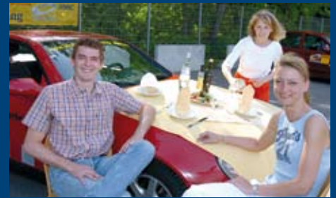
Einladung zum Mittagessen: Bei jedem Tageskurs bis Mitte September.

So lautet auch diesen Sommer wieder das Motto in den Fahrsicherheitsanlagen des ADAC in Augsburg, Kempten/ Allgäu, Regensburg und Landshut. Die ganzen Sommerferien über, vom 2. August bis zum 13. September, gibt es dort zu jedem Tageskurs ein Mittagessen gratis. Egal, ob es sich dabei um ein Pkw- oder Motorradtraining handelt. Infos und Buchungen unter www.sicherheitstraining.net oder Tel.: 01805/ 11 73 11 (0,14 €/Min. aus dem Festnetz, Mobilfunk max. 0,42 €/Min).