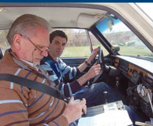
Konzentration mit Stoppuhr und Roadbook.

Im theoretischen Teil werden unter anderem die Vorbereitung, die Ausschreibung, die Ausrüstung, verschiedene Aufgabenstellungen und der Ablauf einer Rallye besprochen. Dabei gilt stets: Die Teilnehmer sollten alles fragen, was ihnen unklar ist. Meist sind die anderen an den Antworten genauso interessiert wie man selbst, und blöde Fragen gibt es nicht. Je mehr man weiß, desto mehr kann man beim praktischen Teil umsetzen. Und Insider-Wissen kann man sowieso nie genug haben: „Damit die Rallye nicht schon vor dem Start verloren ist, muss man das Roadbook, sobald man es erhalten hat, unbedingt Seite für Seite und Zeichen für Zeichen durchforsten. Sie glauben gar nicht, wie oft eine Seite einfach fehlt“, warnt Dinzinger. „Und das wäre fatal!“