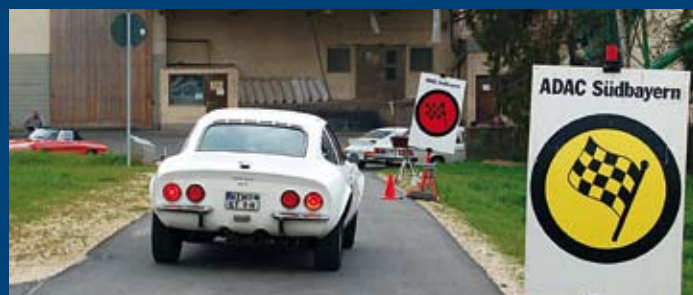
Ein Team durchfährt eine Wertungsprüfung, bei der die Zielzeit mit einer Lichtschranke gemessen wird. Kann es das gerade erworbene Wissen in die Praxis umsetzen?

Wer sich für Oldtimer-Rallyes interessiert und mehr darüber wissen will, sollte auf jeden Fall an einem Lehrgang teilnehmen und sich nicht vor komplizierten und aufwendigen Rechnereien scheuen. Denn eins ist sicher: Es ist noch kein Oldie-Meister vom Himmel gefallen!