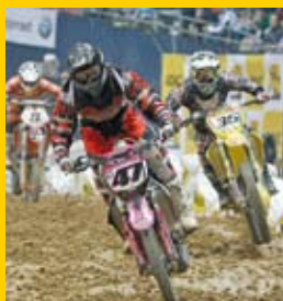
ADAC Supercross München: Hier zahlt sich Planen und Sparen für Ortsclubs aus.

Alle südbayerischen Ortsclubs erhalten auf Eintrittskarten jeder Kategorie für das ADAC Supercross 2010 eine Ermäßigung von 25 Prozent! Diese Aktion ist nicht mit anderen Ermäßigungen kombinierbar.